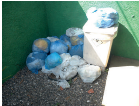
UBS Broderville, em Parnaíba - lixo hospitalar a céu aberto