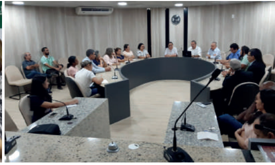
Reuniões com a diretoria do CRM-PI, com funcionários e com gestores da Sesapi, em fevereiro, já visando ações preventivas para a pandemia

No final de janeiro deste ano, fomos surpreendidos com uma infecção viral que começou a matar centenas de pessoas e deixar tantas outras internadas com insuficiência respiratória na província de Hubei, na China. Logo, dezenas de outros países conheceram o horror de que o novo coronavírus poderia trazer para o mundo, sendo declarada a doença Covid-19 como uma pandemia. O CRM-PI se reuniu, discutiu, avaliou e se pronunciou em todas as situações possíveis, mudou os próprios protocolos, informou, sugeriu, recomendou e deixou de recomendar o que estava em voga ou protocolos que foram surgindo, no decorrer dos meses, após março, quando a doença já se