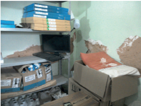
Interior da farmácia em UBS de Miguel Alves - vistoria no mês de agosto

dignidade também durante esses meses de pandemia. Para se ter uma ideia, foram realizadas até o momento 109 fiscalizações no Piauí, a maioria presenciais. Desde março, quando se começaram os decretos de restrições, o Departamento de Fiscalização do CRM-PI, por meio de denúncias ou por rotina, percorreu municípios de norte a sul do Estado, como Parnaíba, Luís Correia, Miguel Alves, Jardim do Mulato, Capitão de Campos, Campo Maior, Monsenhor Gil, Bom Princípio do Piauí, Picos, Marcolândia, Corrente, São Raimundo Nonato, Bom Jesus, Guadalupe, além de várias fiscalizações em Teresina. Na capital, novamente inúmeras irregularidades foram registradas em hospitais de referência, como o Hospital da Polícia Militar e na maior maternidade pública do Estado,